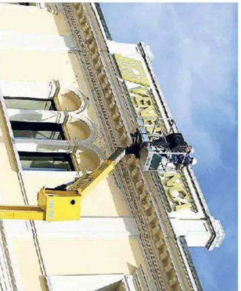
Rimozione dell'insegna dalla sede di Montebelluna di Veneto Banca