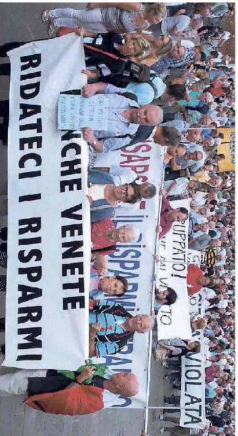
Manifestazione degli azionisti in centro a Vicenza dopo la liquidazione degli istituti