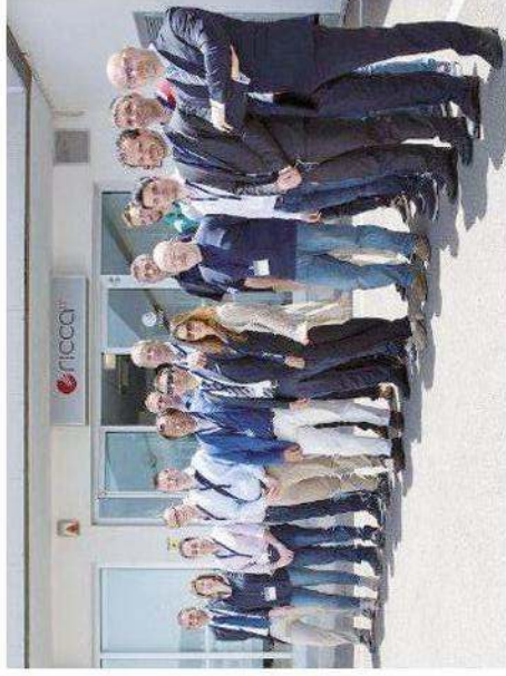
Sopra, il team della Ricca IT di Ragusa. A destra, partecipanti alla Rural Aceademy